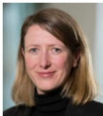
Präsidentin und Sprecherin des Vorstands 2018